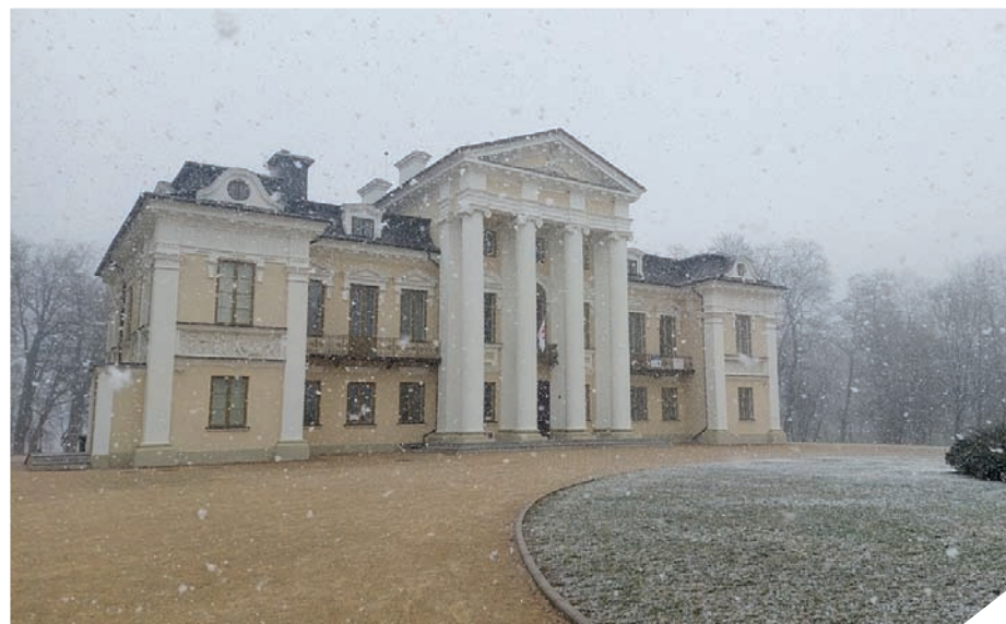
▶ Priešpaskutinę kovo dieną Suvalkijoje iš dangaus pabiro sniegas.