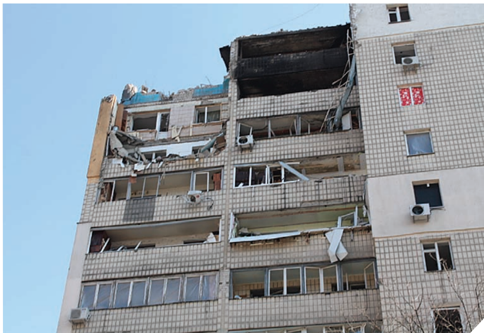
Raketa nukrito į keturioliktą šio namo aukštą ir užmušė pensininką.

Norėdamas patekti į laiptinę visų pirma turi praėti pro kieme styančią griuvėsių krūvą, paskandinusią keturias prie namo stovėjusias mašinas. Du viršutiniai laiptinės aukštai nusėti plytų bei cemento nuolaužų – taip, kaip ir koridorius prie žuvusiojo buto.