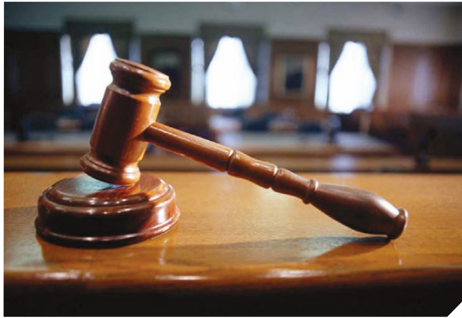
▲ Teismas priėmė verdiktą: apriboti laisvę ir sumokėti skolą.

Tačiau „Audi A8“ reikėjo susiremontuoti už savus pinigus. Eismo įvykio deklaracijoje buvo įvardyta, kad avarijos metu apgadintas priekinis stiklas, kairysis sparnas, variklio dangtis, durys, galinis bamperis, veidrodėlis. Nenuostabu, kad apgaditimai susidūrus net su trimis mašinomis buvo nemaži.