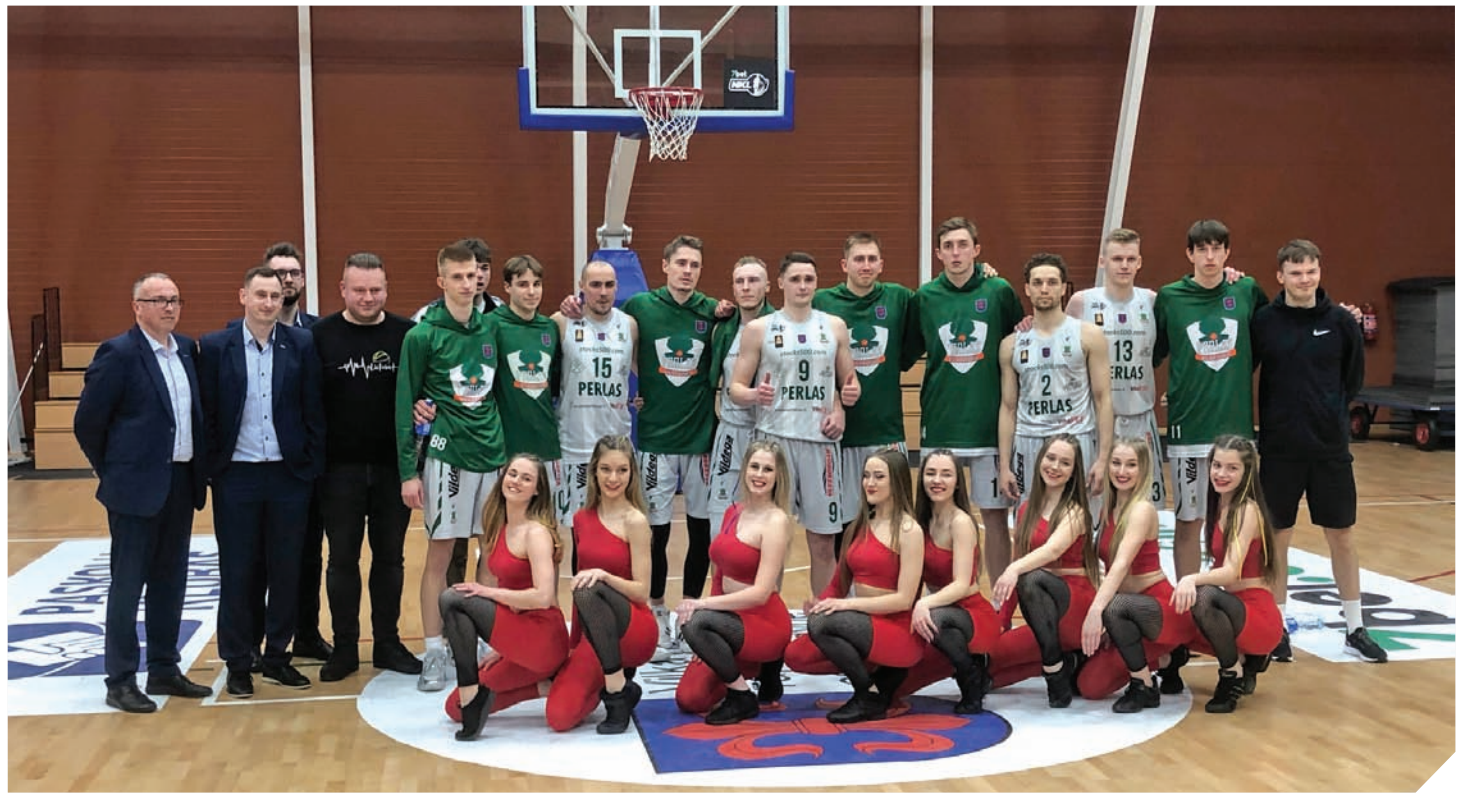
Šį sezoną „Perlo“ komanda demonstravo rezultatyvų bei sirgalių akims itin gražų krepšinį.

„Visą sezoną sirgaliai buvo mūsų varomoji jėga. Jei ne jie, nereikėtų ir komandos. Neretai aistruoliai būdavo tarsi šeštasis žaidėjas. Jautėme didžiulį palaikymą tiek po pergalių, tiek po pralaimėjimų. Pastebėjome, kad į rungtynes susirinkdavo daug vaikų, – džiugu, kad auga krepš-