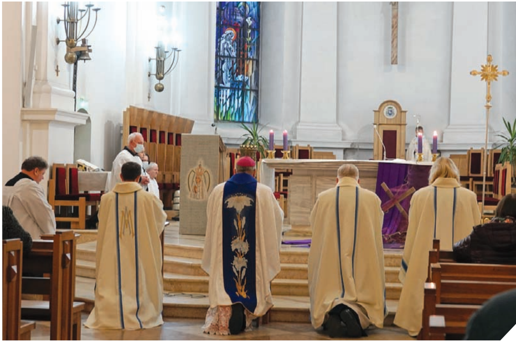
■ Iš paaukojimo maldos Vilkaviškio katedroje.

Kovo pradžioje Rusijos agresijos prieš Ukrainą akivaizdoje į popiežių Pranciškų su prašymu paaukoti Rusiją ir Ukrainą Nekaltajai Marijos širdžiai kreipėsi Ukrai-