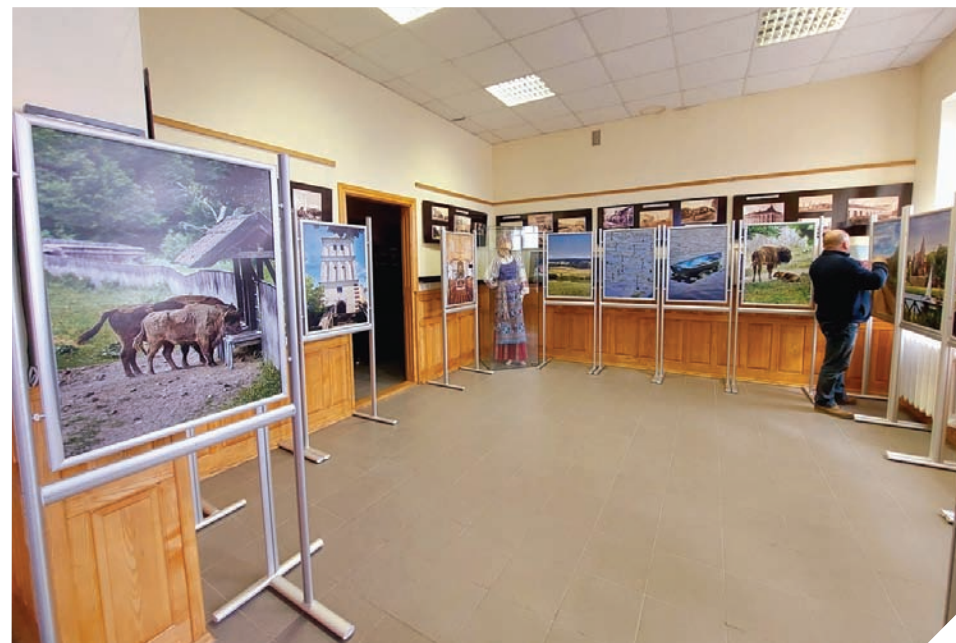
▲ Fotografijose – įspūdingos Lenkijos gamtos ir lankytinų vietų vaizdai.