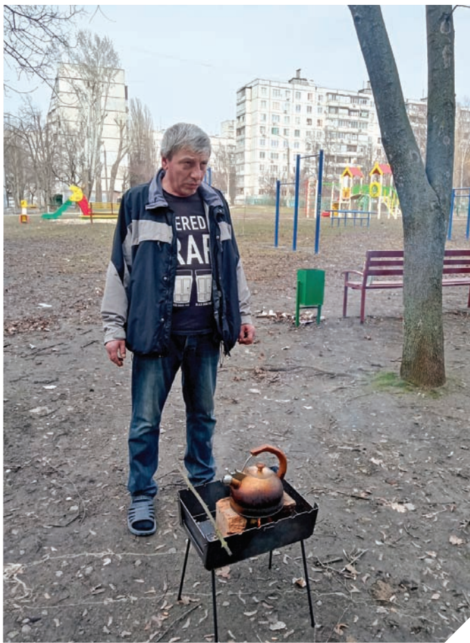
Be būtiniausių patogumų likę žmonės maistą verda ant laužo.

Dar blogesnėje padėtyje liko tie asmenys, kurie nesugėjo pabėgti iš namų, atsidūrusių susišaudymų epicentre. Vieno iš tokių namų rūsyje jau mėnesį gyvena aštuoniolika žmonių, čia susispietusių iš kelių aplinkinių daugiaaukščių. Kartu jiems drąsiau, kartu gali pagelbėti vieni kitiems,