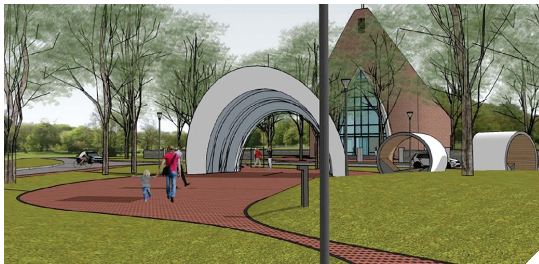
➤ Tokią Liepų parko viziją šalia Alvito bažnyčios mato vieno iš didelės apimties projektų rengėjai.