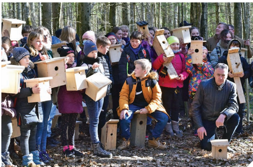
▲ Padovanojome paukščiams namus.

Iškelti inkilai daugiausiai skirti smul-